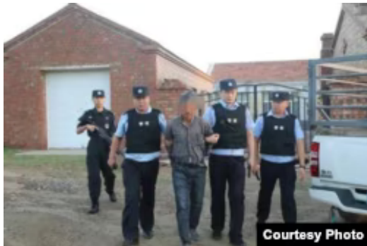
乌拉特前旗牧民因抗议矿企华拓矿业有限公司而遭到当地公安当局的逮捕

据牧民家属透漏，这起旷日持久的拘押和审判，截至上周五已经进行了93天，预计本星期结束。牧民当中有重病患者和年近八旬的老人，他们坐在轮椅、躺在病床上，带着手铐脚镣被拘留和审讯。